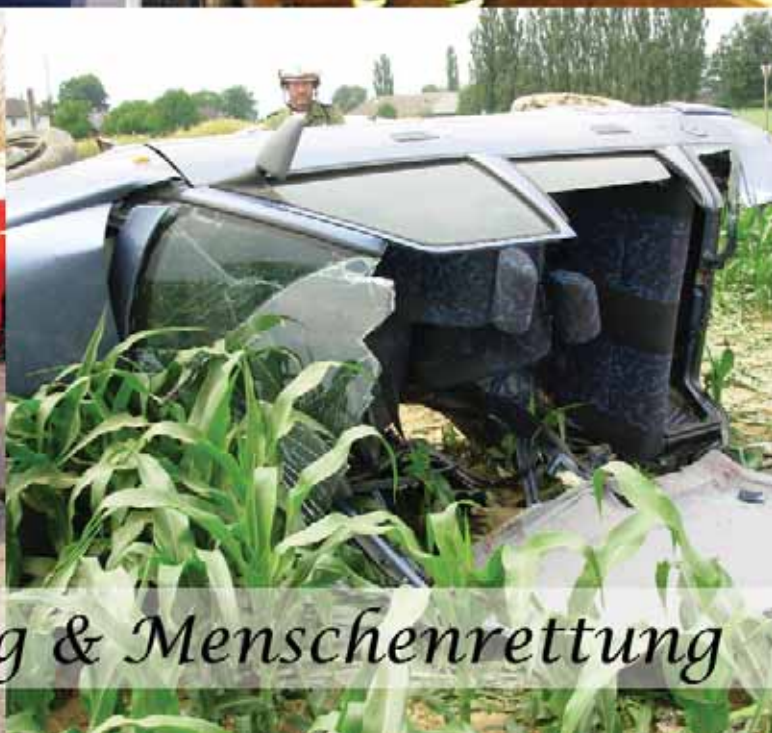
Fahrzeugbergung & Menschenrettung